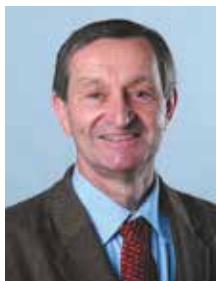
Dr Gérard Bapt Médecin cardiologue, Député de Haute-Garonne (PS), Membre de la commission des affaires sociales de l'Assemblée nationale, Rapporteur sur les recettes et l'équilibre général du projet de loi de finances (PLFSS) pour 2015