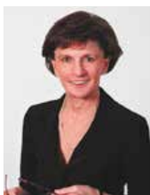
Dr Michèle Delaunay Médecin cancérologue Députée PS de la Gironde, Ancienne ministre déléguée aux personnes âgées et à l'autonomie